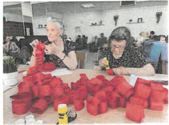
Trabalhos manuais - Baile da Pinha