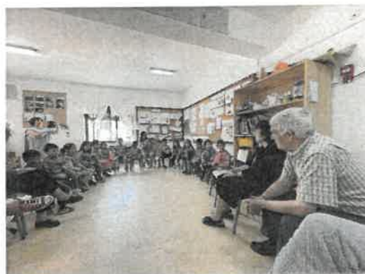
Atividade Intergeracional - C.I.N.S.C.