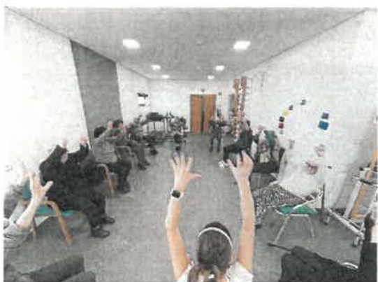
Tardes Saudáveis p/ UFMSA