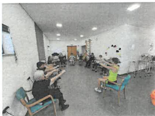
Tardes Saudáveis p/ UFMSA