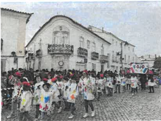
Desfile de Carnaval