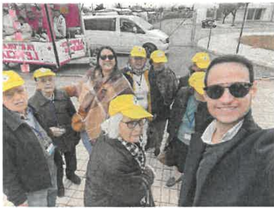
Visita ao Mercado de Moura