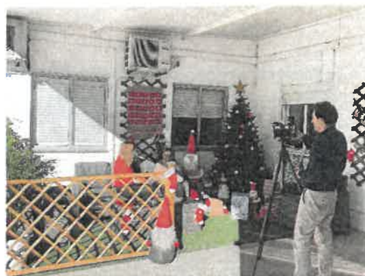
Entrevista sobre o Natal