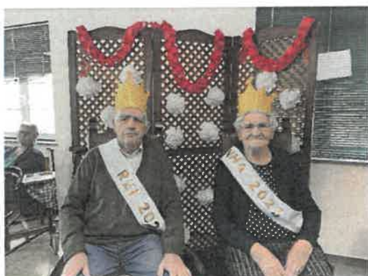
Baile da Pinha