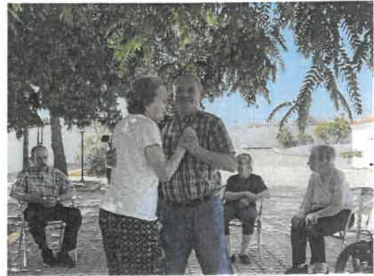
Cantares alentejanos / Dança