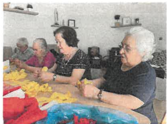
Trabalhos Manuais - São João