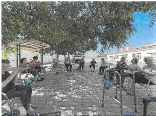
Manhãs de cante/convívio