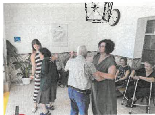
Comemoração São Pedro