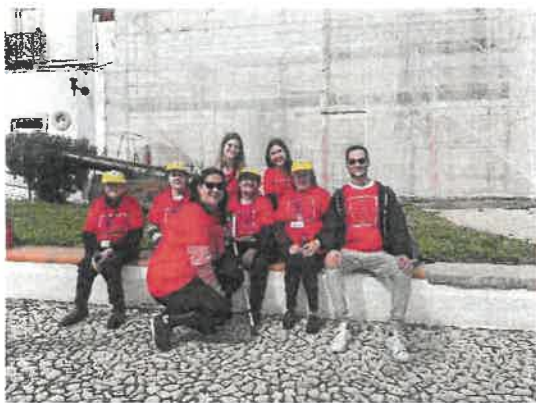
Caminhada Dia da Mulher