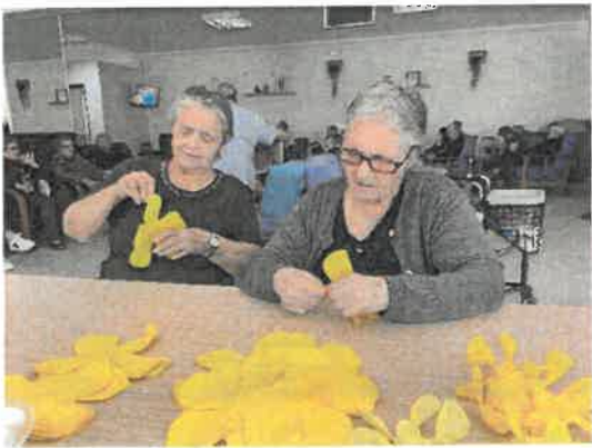
Trabalhos manuais - São João