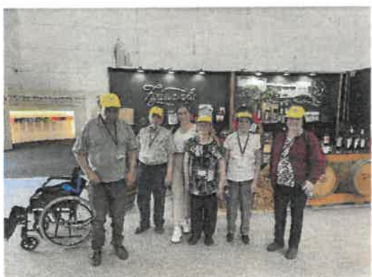
Passeio à Ovibeja