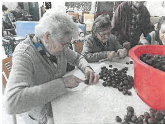
Arretalhar castanhas para o S. Martinho