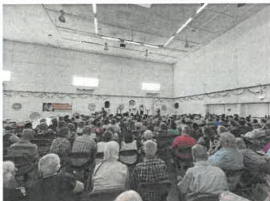
Dia do idoso e da Música