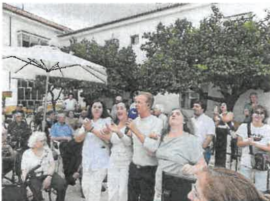
Visita do programa televisivo "Domingão"