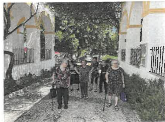
Passeio ao Jardim Dr. Santiago