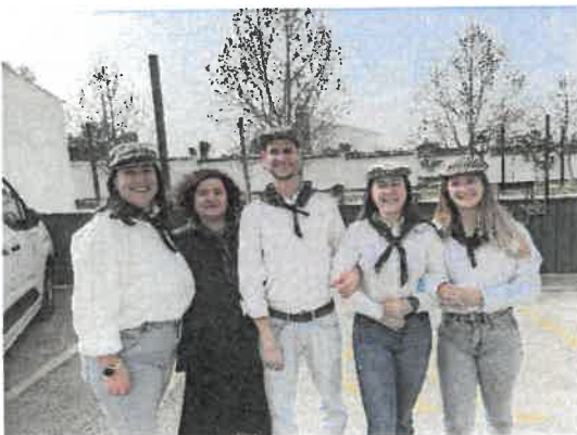
Festa da Carnaval