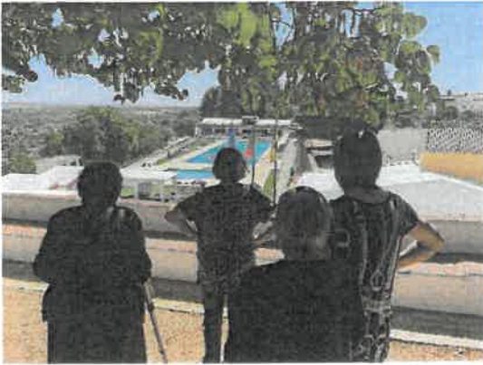
Passeio ao Jardim Dr. Santiago