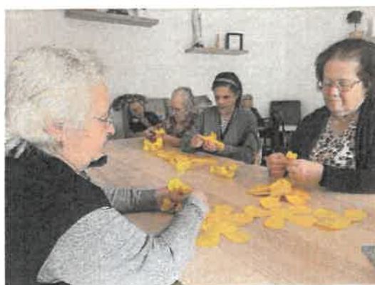
Trabalhos Manuais - Mastro