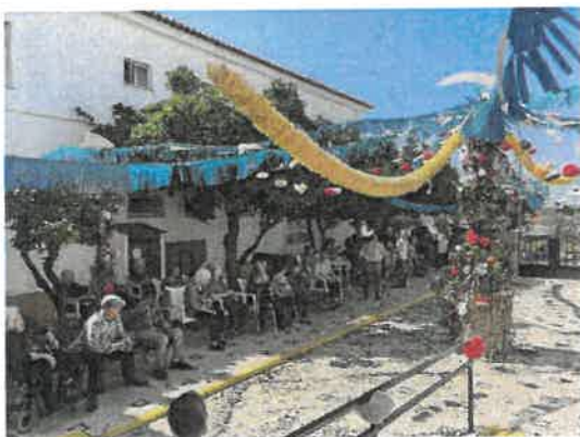
Comemoração São João