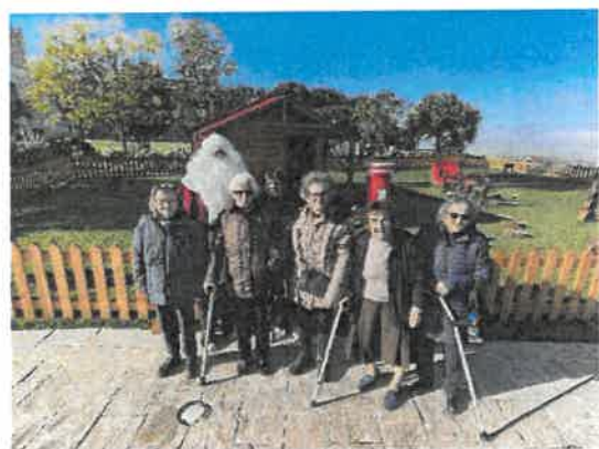
Visita ao Castelo Encantado