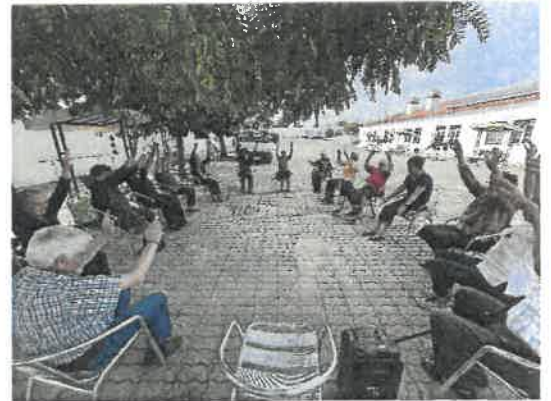
Classes de Animação e Fisioterapia