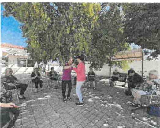
Manhãs de convívio / cante / dança