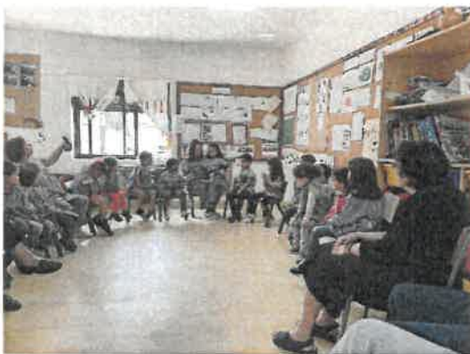
Visita ao Centro Infantil N.ª S.ª do Carmo