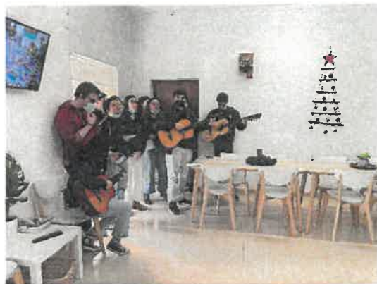
Grupo de Jovens