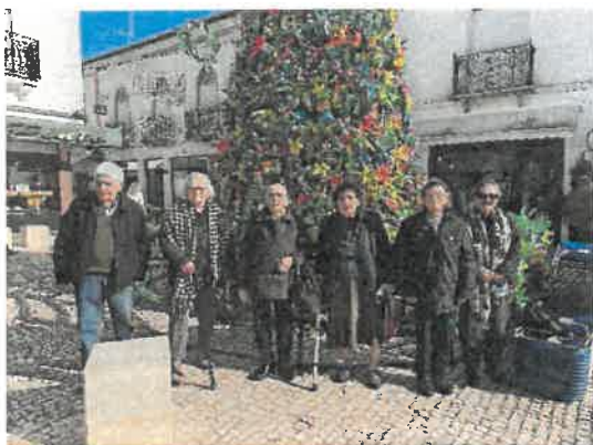
Árvore da Partilha