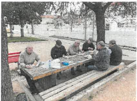
Lanche convívio da Porta Nova