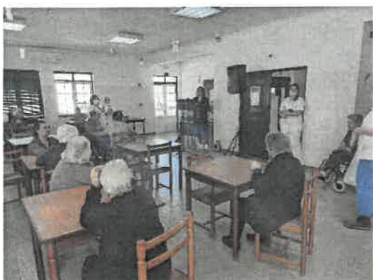
Festa da Páscoa