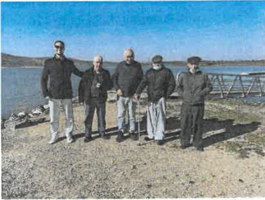
Passeio à Barragem do Alqueva