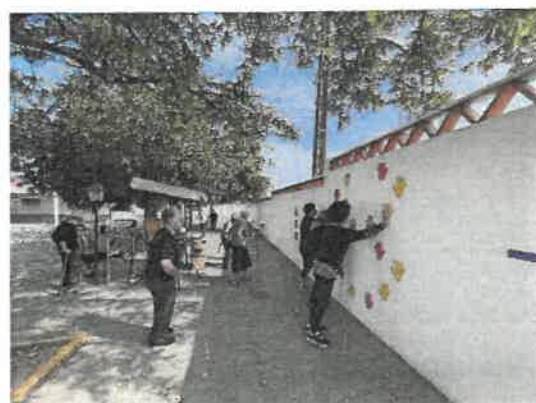
Classes de Animação e Fisioterapia