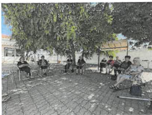
Manhãs de convívio