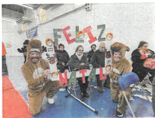
Festa de Natal das Escolas