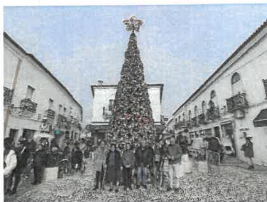
Árvore da Partilha