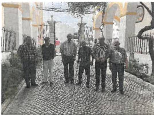
Passeio do Jardim Dr. Santiago