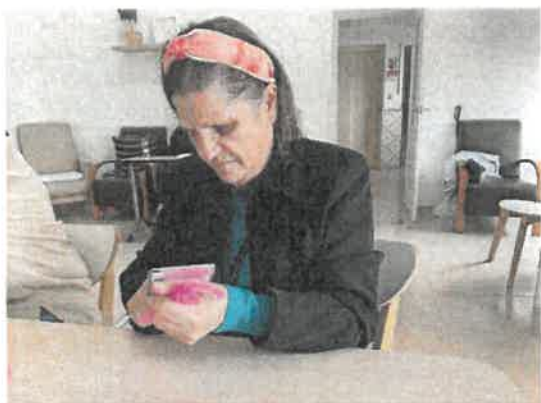
Trabalhos manuais - Árvore da Partilha