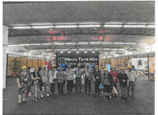
Visita à Feira de Setembro