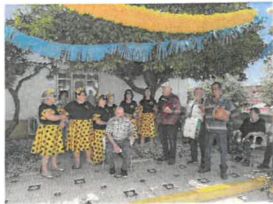
São João - Grupo Coral