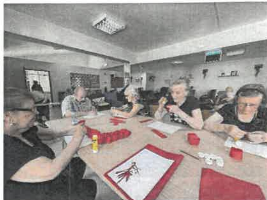
Trabalhos manuais - Baile da Pinha