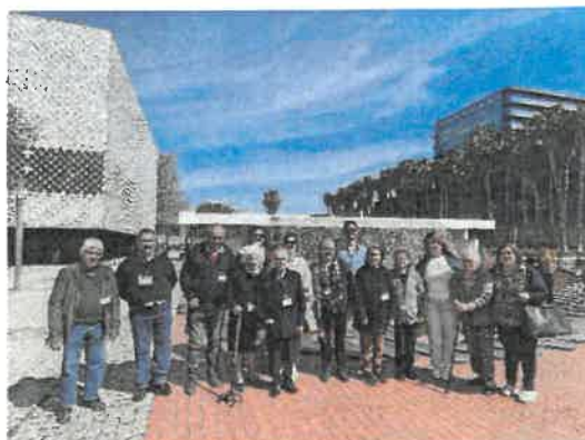
Passeio ao Oceanário de Lisboa