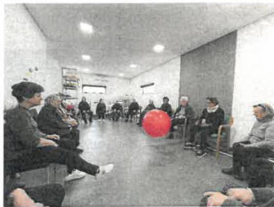
Classes de Animação e Fisioterapia