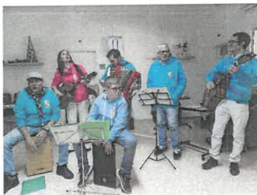
Festa de Natal