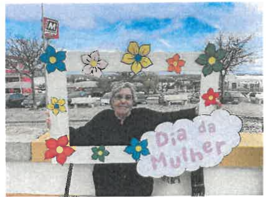
Comemoração Dia da Mulher