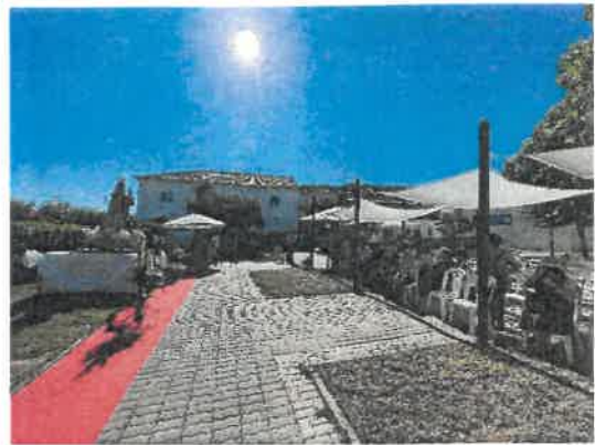
Visita da Imagem de N.ª S.ª do Carmo