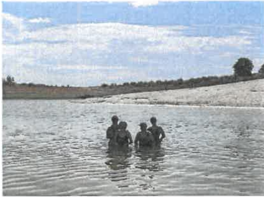
Praia Fluvial de Alqueva