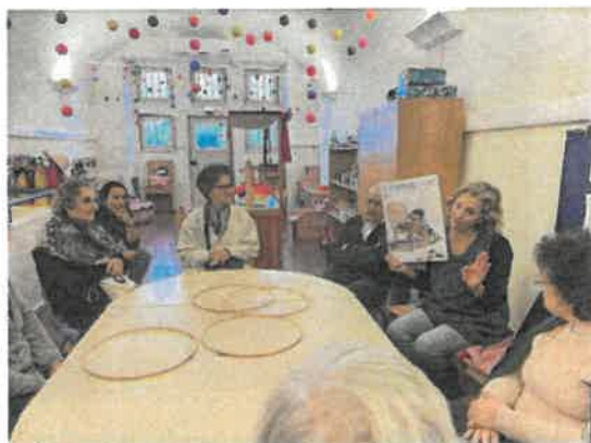
Atividade com a Ludoteca