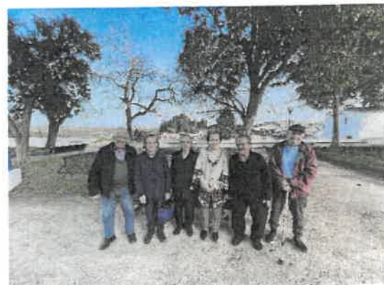
Passeio ao Jardim Dr. Santiago