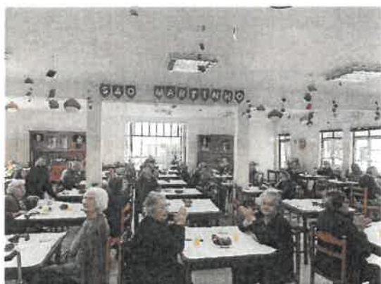
Festa de São Martinho