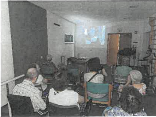
Cinema - Pátio das Cantigas