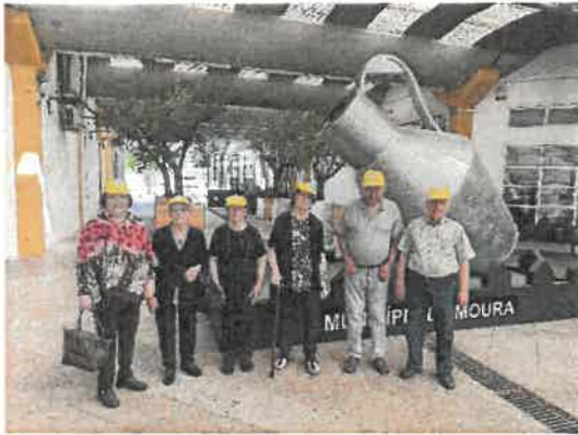
Visita à XVI Olivomoura