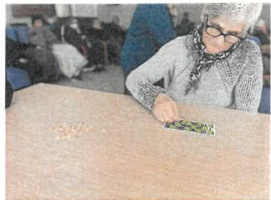
Dinâmica de grupo - Loto