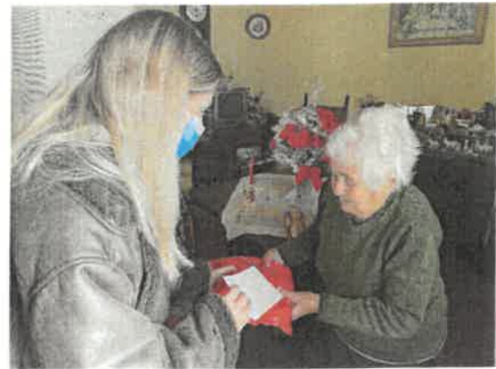
Oferta de prenda de Natal SAD