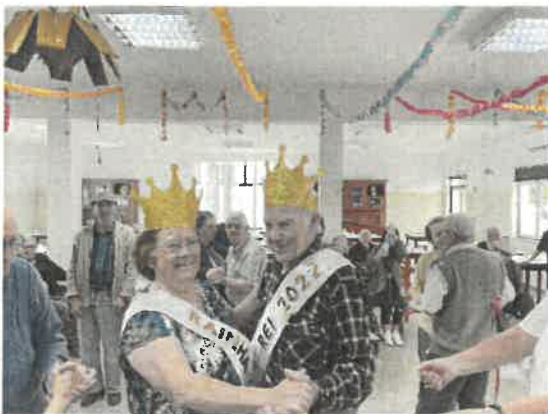
Baile da Pinha