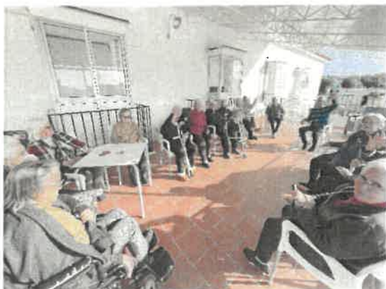
Convívio na varanda do 1º andar