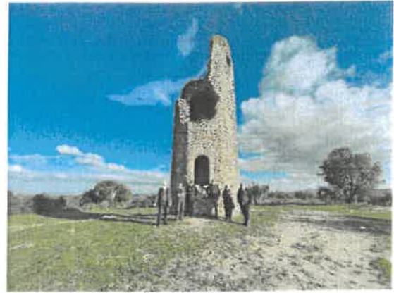
Passeio à Atalaia Magra